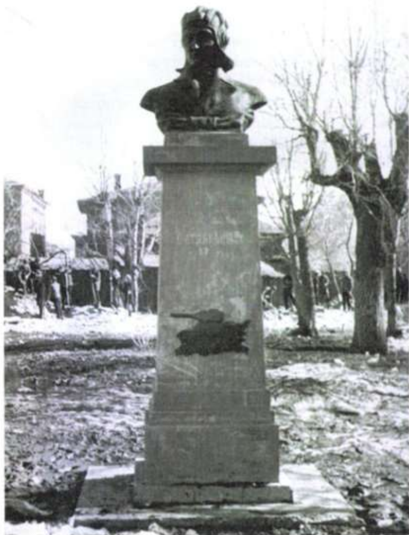
Памятник Герою Советского Союза Марии Васильевне Октябрьской