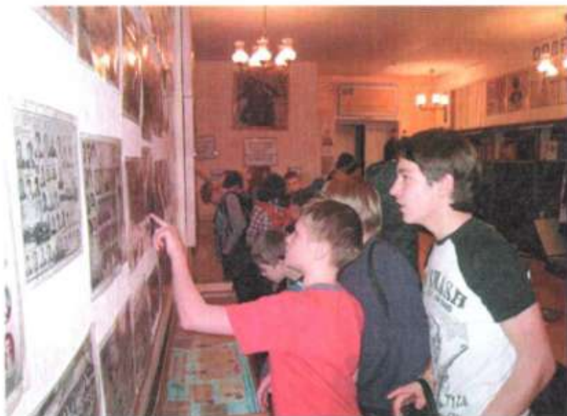
Экскурсия «История создания школьного музея». Октябрь 2012 г.