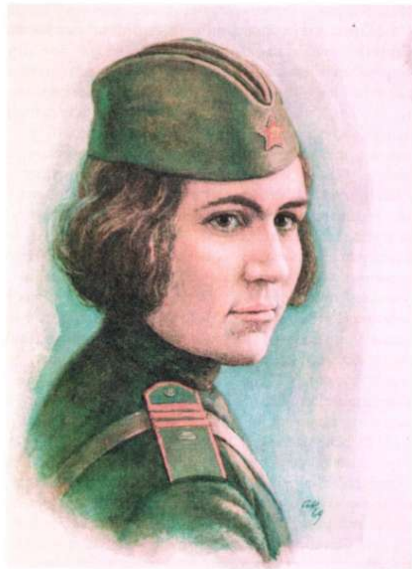
Герой Советского Союза Мария Васильевна Октябрьская