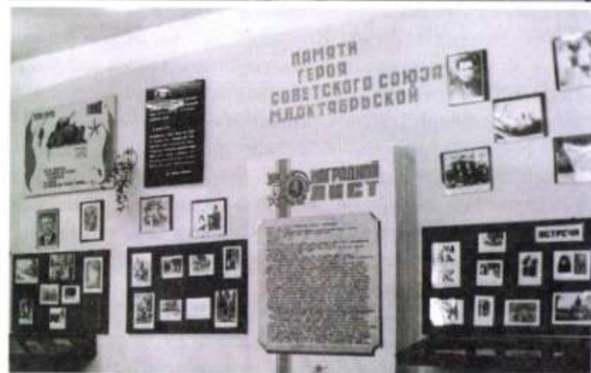
Музей «Боевой славы» имени М.В. Октябрьской школы № 24