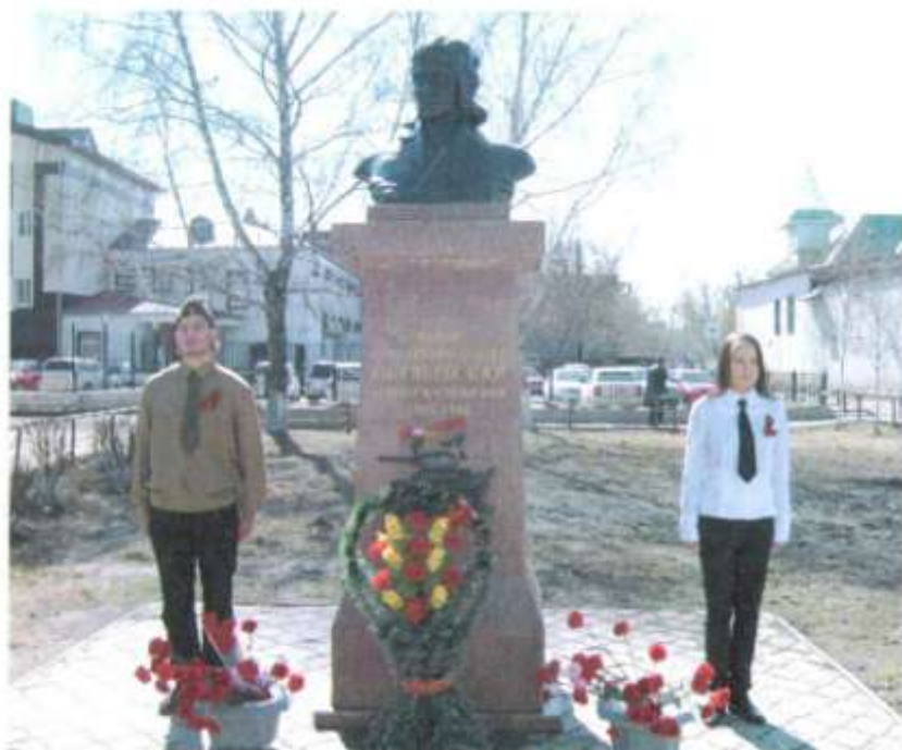
Вахта памяти у памятника Герою Советского Союза М.В. Октябрьской. Май 2013 г.

ренциях. В 2010-2011 учебном году в городском конкурсе экскурсоводов музеев занял 3 место. В городском смотре-конкурсе школьных музеев – 3 место. В 2012-2013 в городском и областном смотре-конкурсе школьных музеев – 1 место.