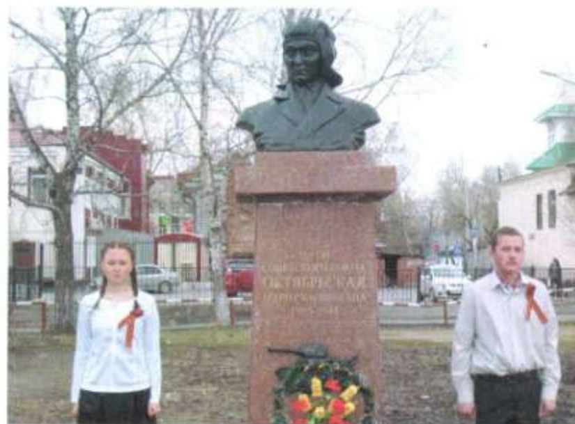
Вахта памяти у памятника Герою Советского Союза М.В. Октябрьской. Май 2010 г.

Мы гордимся историей своей школы, ведь у нас очень богатая и интересная история. Самым интересным мероприятием является игра по истории гимназии. В течение учебного года обучающиеся 1-11 классов