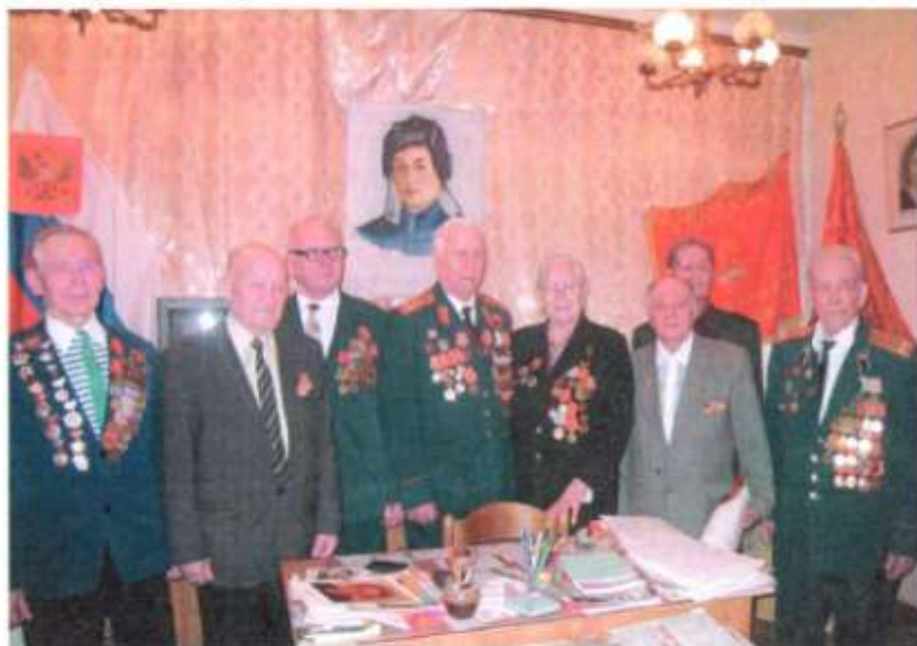
Встреча с ветеранами Великой Отечественной войны

ветеранов актив музея организует и проводит встречи обучающихся с ветеранами Великой Отечественной войны и тружениками тыла.