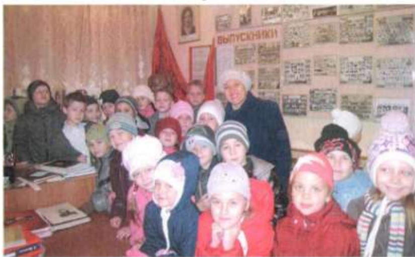
Экскурсия для первоклассников. Сентябрь 2014 г.