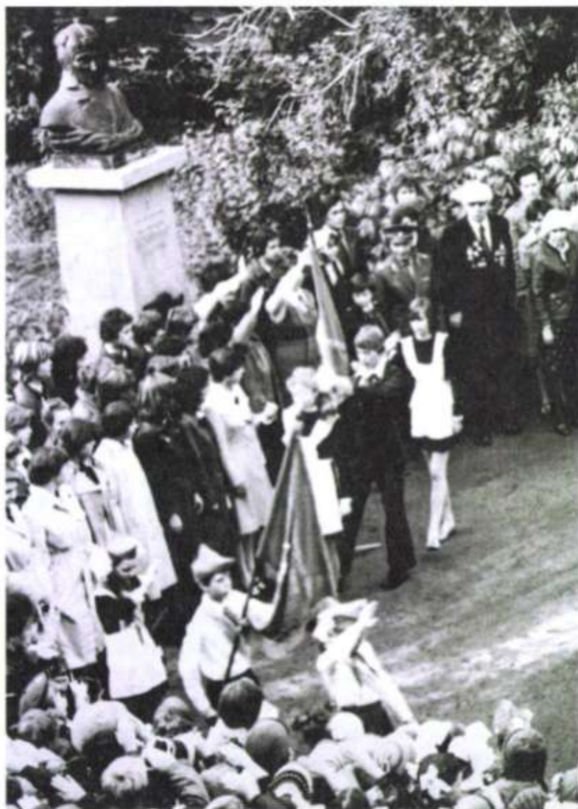
Митинг, посвященный памяти Героя Советского Союза М.В. Октябрьской

кабельщик» от 17 сентября 1976 года вышла статья «Памятью героев – клянемся!» 24 .