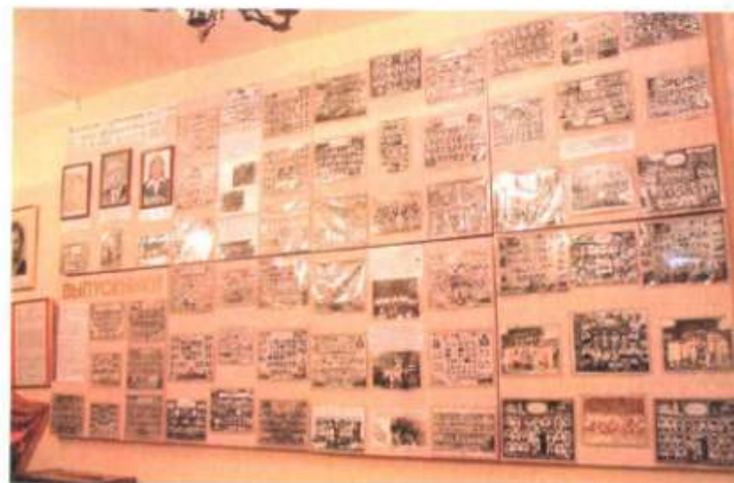
Галерея выпускников школы-гимназии № 24