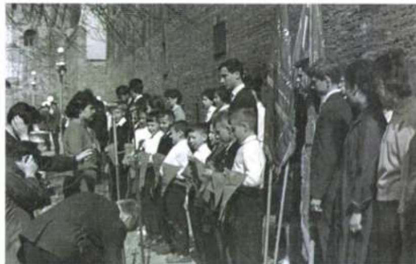
Год 1965. Пионеры и комсомольцы школы № 24 в городе Смоленске у Кремлевской стены, где похоронена Мария Васильевна Октябрьская