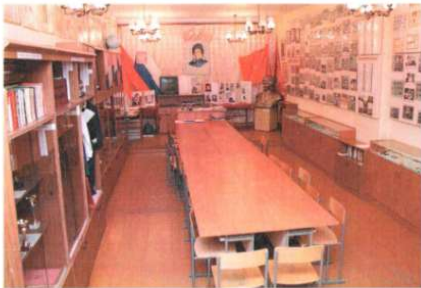
Музей истории гимназии № 24 им. М.В. Октябрьской