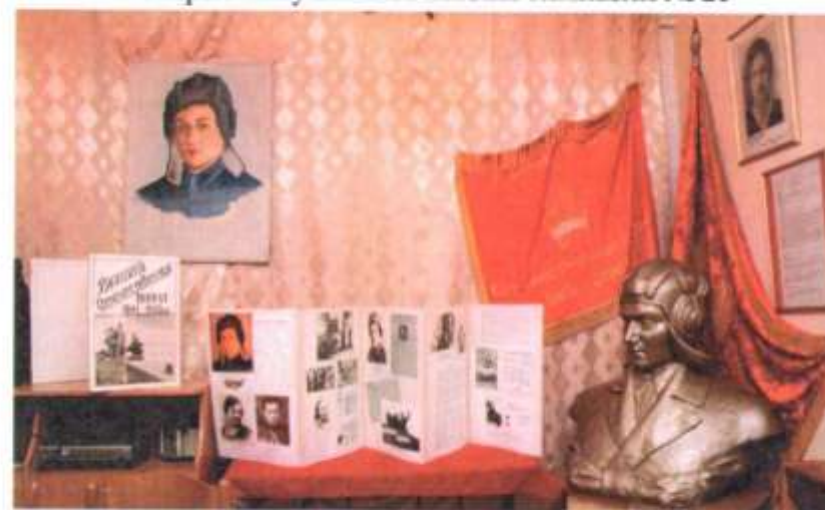
Экспозиция, посвященная М.В. Октябрьской