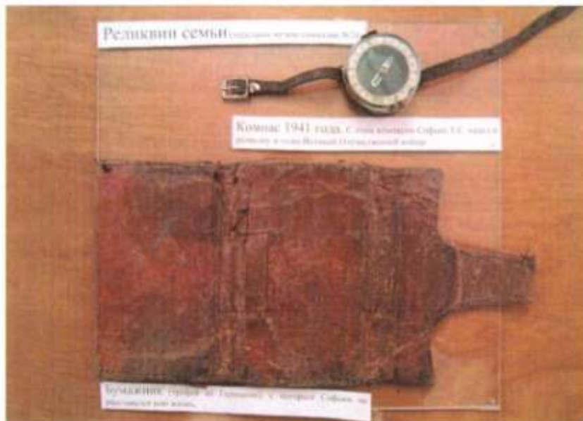
Ценные экспонаты музея